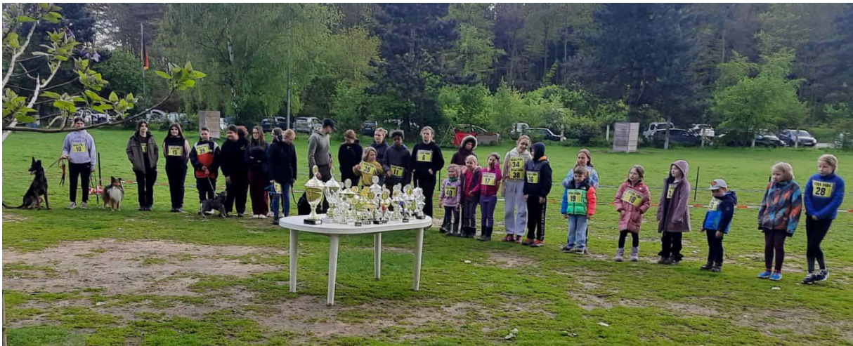
LG-JJM 2024 - Teilnehmer Hunderennen