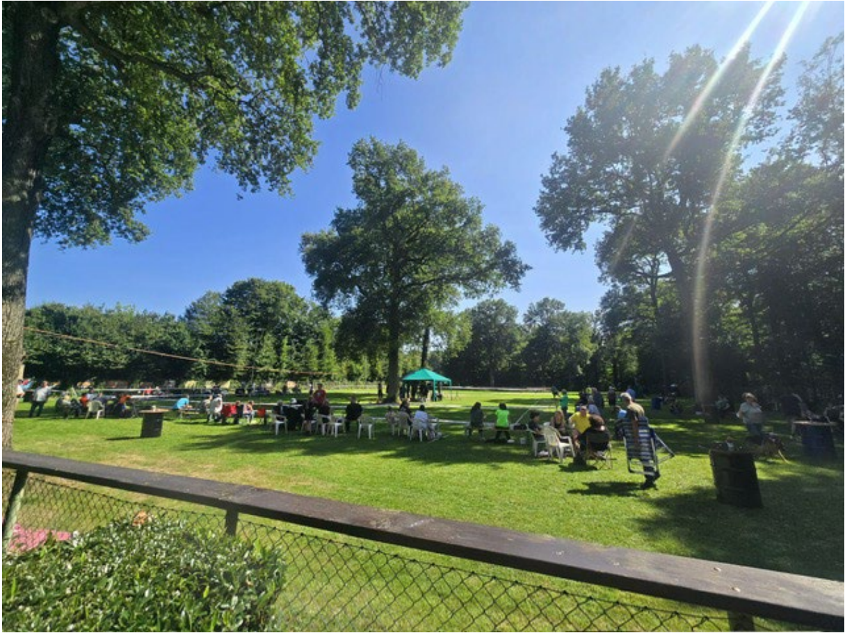
LG-Jugendschau – OG Duisburg-Wedau