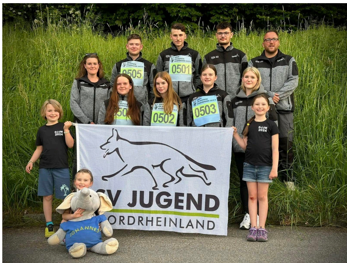
DJJM – Mannschaft LG05

Mein Dank gilt auch dem FVJ Nordrheinland, der Landesgruppe Nordrheinland und der Firma Bende, die unsere Mannschaft an diesem Wochenende sehr unterstützt haben.