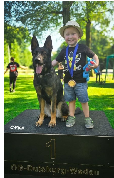
LG-Jugendschau – Kind trifft Hund