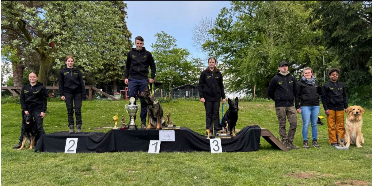
LG-JJM 2024 - Teilnehmer IGP