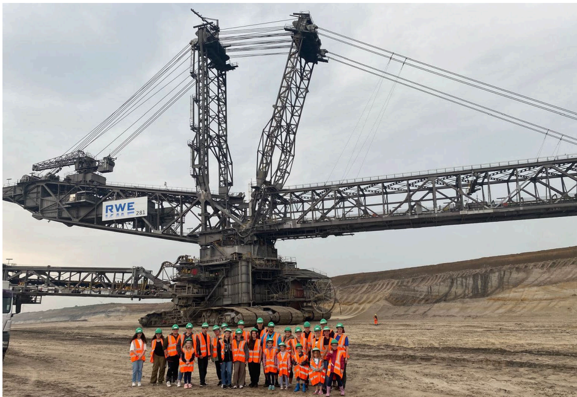
Zeltlager – Ausflug Tagebau Hambach

Ein weiterer Dank gilt den Eltern/Betreuern, die mich in der Durchführung tatkräftig unterstützten. Schön, dass wir Jahr für Jahr an einem Strang ziehen. Besonders hervorheben möchte ich unseren FVJ Nordrheinland, der das gesamte Zeltlager finanziell übernahm.