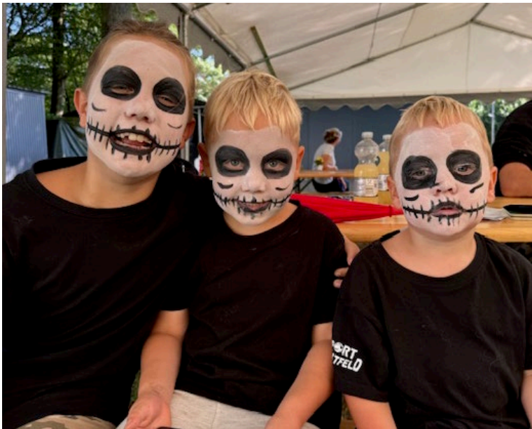
LG – Jugendschau – Kinderschminken